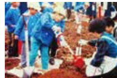
ニュートンりんご並木に植樹