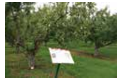
Wisley Garden りんご園