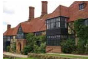
The Royal Horticultural Society

1990年にイギリス大使館員や地元の保育園児らの手により、ニュートンりんご並木に植樹されました。植樹から30年以上が過ぎ、このうちのブラムリーズ・シードリング、プレナム・ハイム・オレンジ、ベル・ド・ボスクープ、エグレメント・ラセット等は、現在では町内のりんご農家が栽培しています。ジュース・ジャム・シードル等の加工品も造られ活用されています。