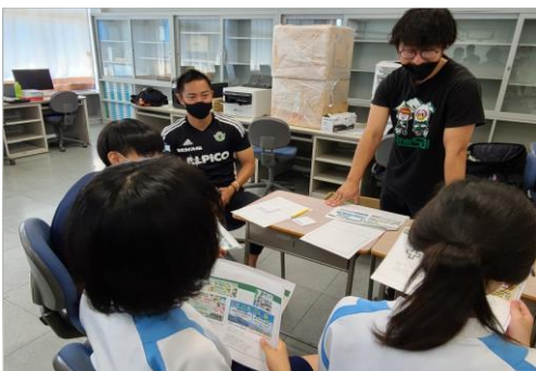
⑨ キャリア講話と経営WS（松本山雅）