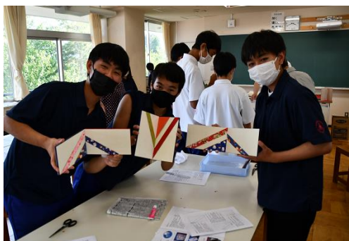
⑩ からくり屏風作り（表具師）