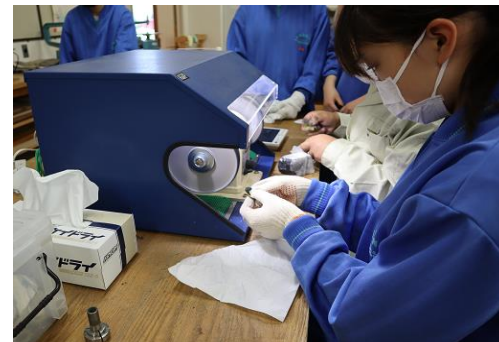
⑧ バブ研磨体験（アクセサリー作り）