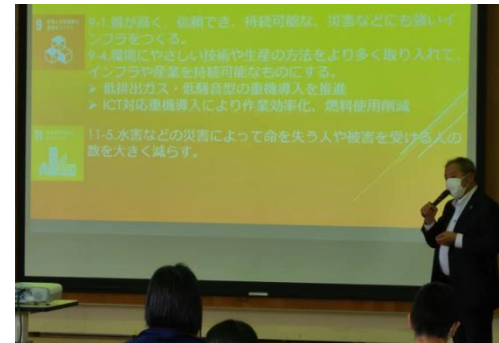
④ SDGs 講話