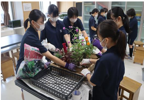
⑤ ミニチュア庭園作り体験（造園）