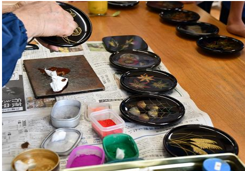
⑦ 絵皿の沈金加工体験（木曾漆器）