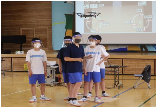
⑥ ドローン操縦（プログラミング）