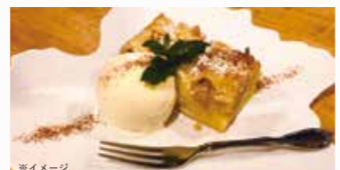
※イメージ 英国りんごのブラムリークランブルケーキ バナナアイス添え

[日時] 9月3日(土) 11:00～12:30 [場所] シェアキッチン [持ち物] エプロン、三角巾、手ふき [定員] 12名 [参加費] 1,000円 [講師] ワイナーレストラン・サンクゼールシェフ 中村悟史さん