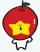
飯網町 PR キャラクター「みつどん」