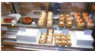
※画像は過去に開催したものです、実際の販売作品と異なる場合がございます。

【日時・場所】 ながの東急百貨店:10月28日(木)~11月3日(水・祝) 泉が丘喫茶室:10月30日(土)、31日(日)、11月3日(水・祝) いいづなマルシェ むーちゃん:10月30日(土) パスあいのり3丁目テラス (新宿東口) 11月5日(金)・6日(土)・7日(日)