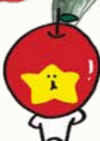
飯網町 PR キャラクター「みつどん」